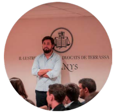
Fernando Carrera Inspiring FC