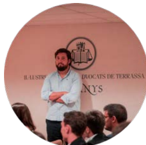
Fernando Carrera Inspiring FC